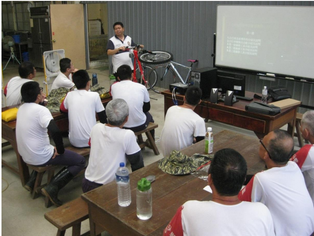
自行車維修班相關課程